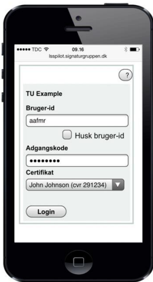
Medarbejdersignatur login fra smartphone

Desuden kan man nu gå på tjenester så som FMK-online, skat.dk og NemLog-In fra en mobil enhed hos medarbejderne.